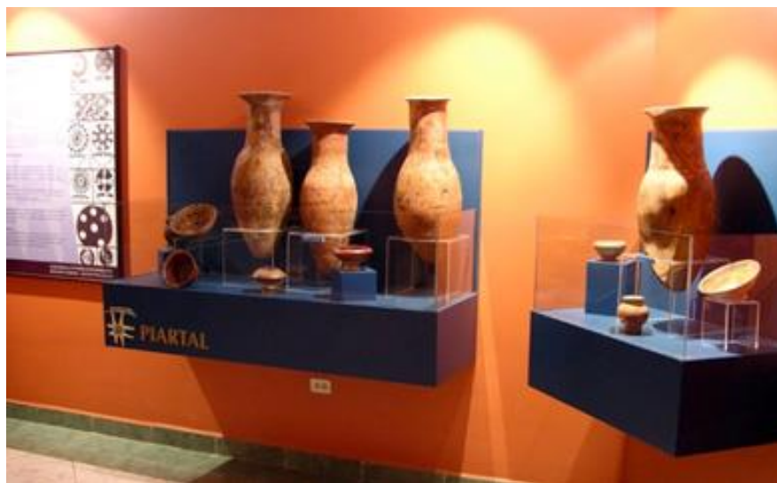
Figura 3. Museo Germán Bastidas Vaca