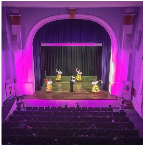
Figura 6. Teatro Lemarie