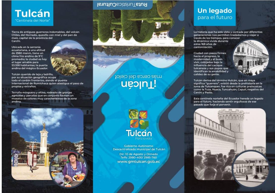
Figura 3. Tríptico de Ruta Turística Cultural de la ciudad de Tulcán