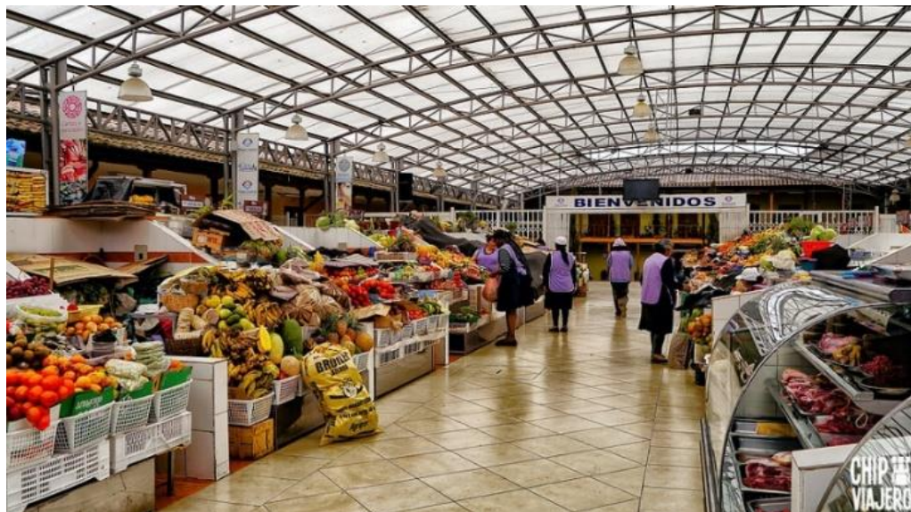
Figura 5. Mercado Central