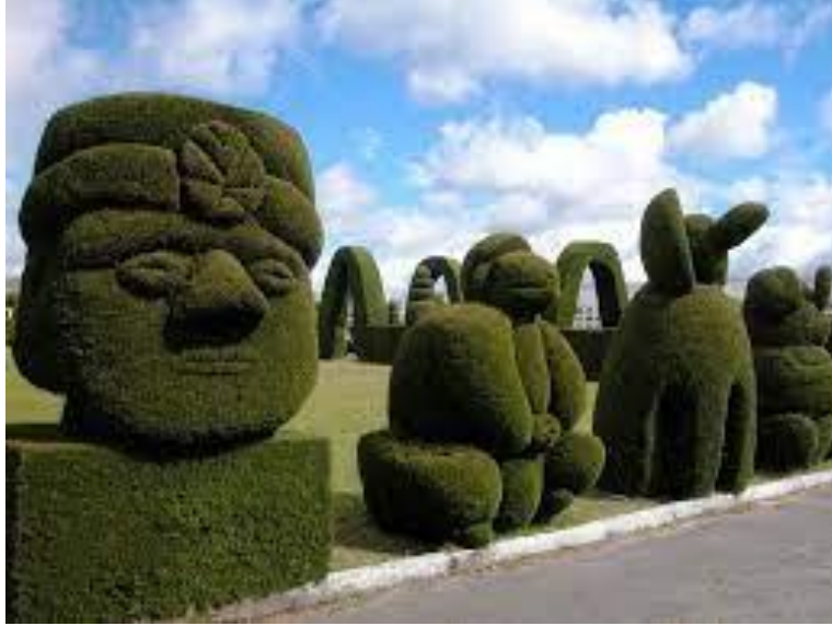
Figura 2. Cementerio Municipal José María Azael Franco de la ciudad de Tulcán