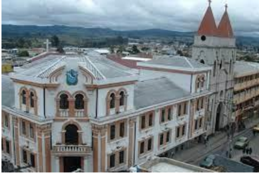
Figura 4. Iglesia San Francisco