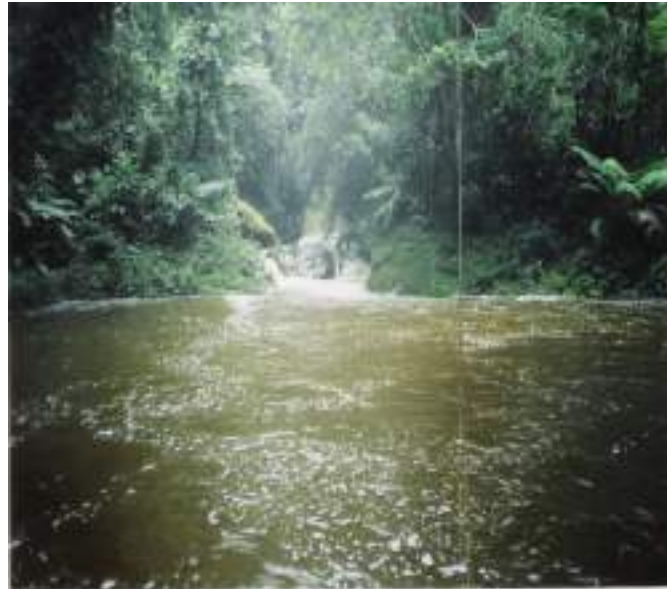
Figura 9. Huaman Posa