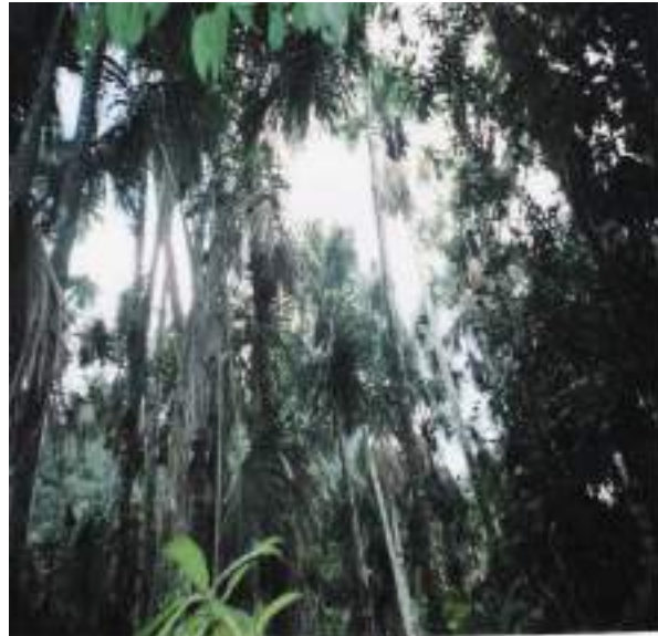
Figura 6. Bosque de Aguajales