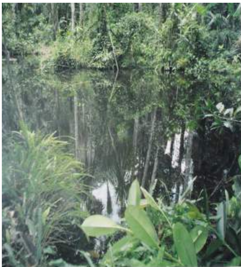
Figura 12. Laguna de Pizana