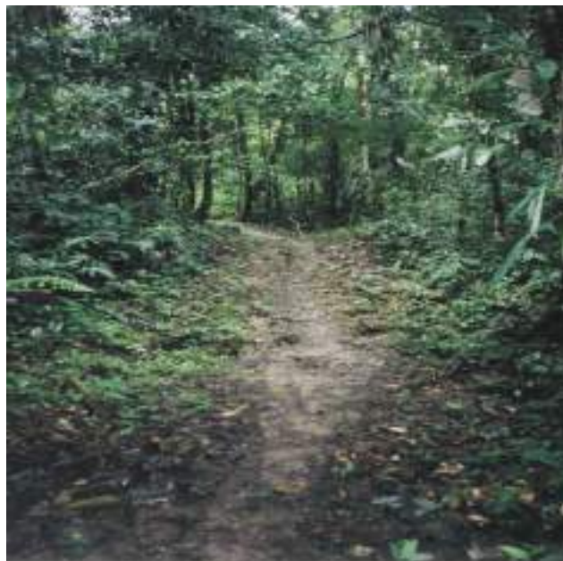
Figura 11. Ecoruta de Pizana