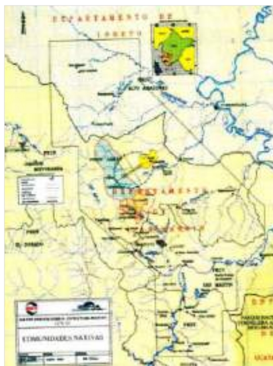
Figura 2. Mapa del área de influencia del programa de exploración de petróleo en la comunidad nativa de Yurilamas