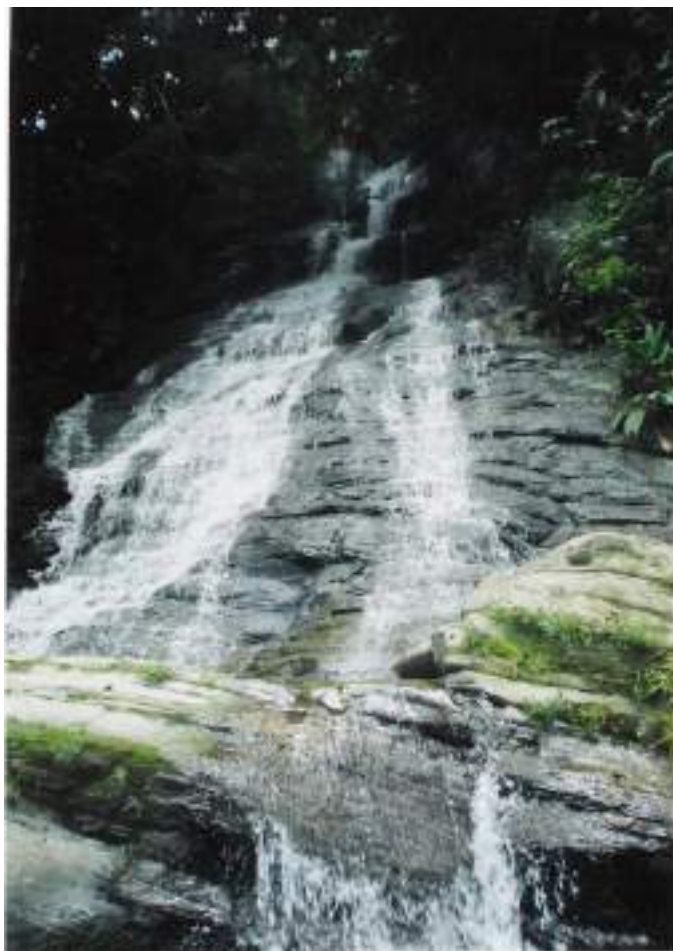
Figura 4. Cascada de Izulilla