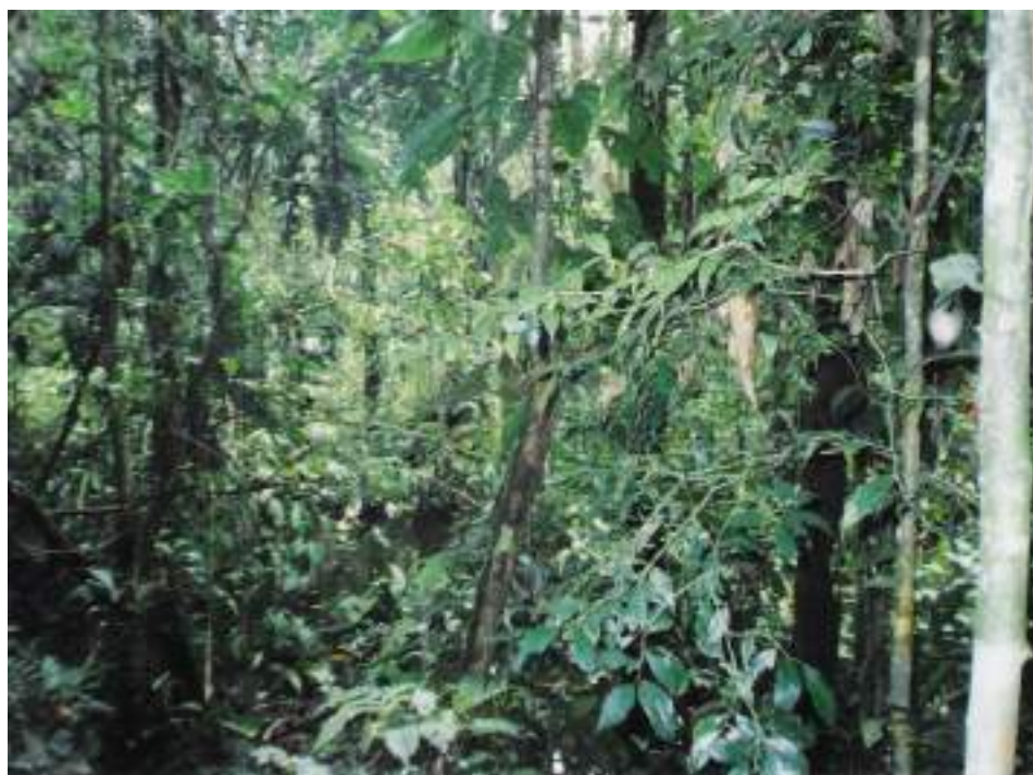
Figura 5. Collpa animales