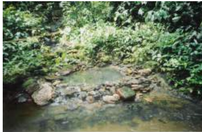
Figura 10. Baños termales del Shanusi