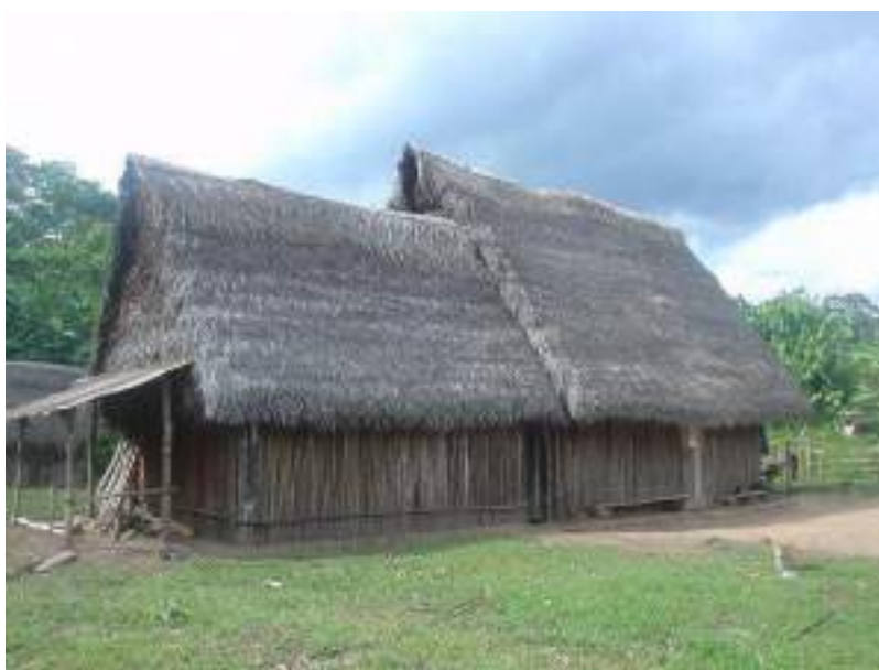
Figura 13. Chacra Nativa