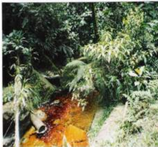
Figura 7. Baños Sulfurosos