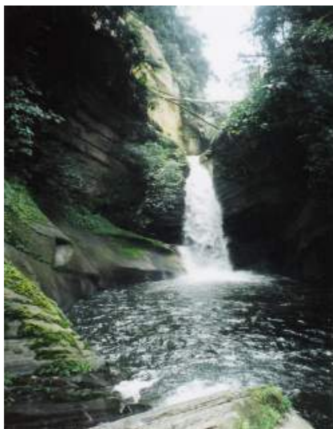
Figura 3. Cascada de Izula