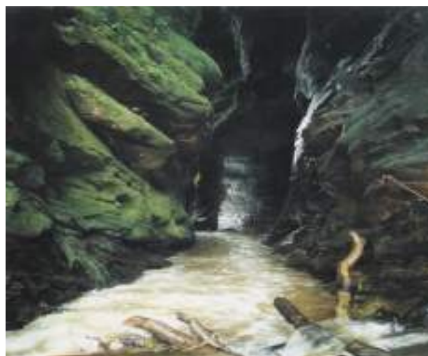
Figura 8. Cañón del Shidushidu